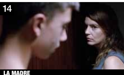
14 LA MADRE

Mientras el rey de los belgas se encuentra en Estambul realizando una visita de Estado, se produce la fractura de su país. Su regreso no admite dilación, pero una tormenta solar provoca el cierre del espacio aéreo.