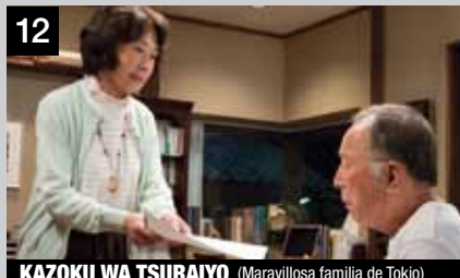
12 KAZOKU WA TSURAIYO (Maravillosa familia de Tokio)

Mathilde trabaja para la Cruz Roja con el fin de garantizar la repatriación de los prisioneros franceses tras la Segunda Guerra Mundial. Su sorpresa llega cuando descubre que gran parte de las hermanas de un convento están embarazadas por soldados del Ejército Rojo.