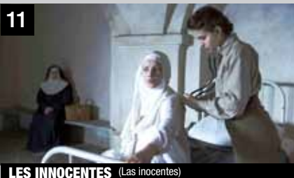
11 LES INNOCENTES (Las inocentes)

Dirección: Anne Fontaine. Intérpretes: Lou de Laâge, Agata Buzek, Agata Kulesza. Francia/Polonia , 2016 115'