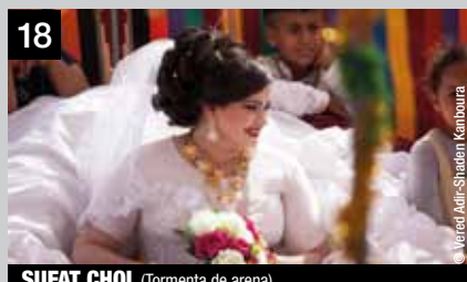
18 SUFAT CHOL (Tormenta de arena)

Todo empieza con un amanecer y tres jóvenes surfistas sobre un mar embravecido. A las pocas horas, mientras vuelven a casa, tiene lugar un accidente.