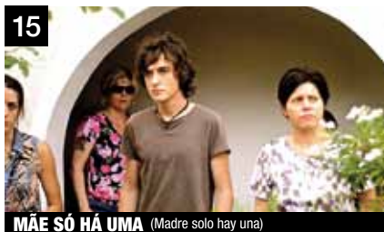
15 MÃE SÓ HÁ UMA (Madre solo hay una)

Miguel es un crío de 14 años a punto de volver a entrar en un centro de menores. Su madre, sin trabajo y con una vida personal inestable, es incapaz de ocuparse de él.