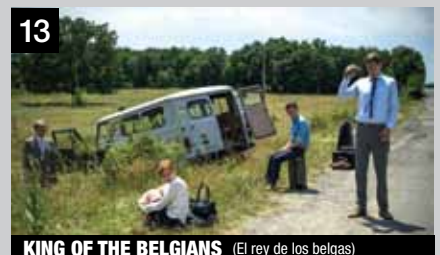
13 KING OF THE BELGIANS (El rey de los belgas)

El día en que Tomiko cumple años, su marido, Shuzo, le pregunta qué regalo le gustaría. Ella le responde: 'El divorcio'. Al enterarse de la noticia de la separación de la pareja, sus hijos se ven invadidos por el pánico.