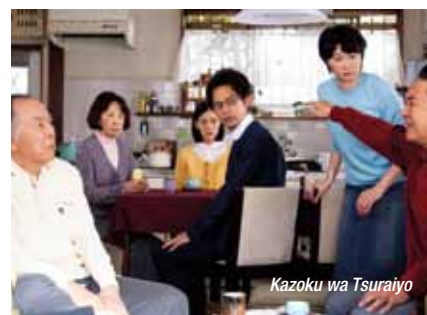
Kazoku wa Tsuraiyo

clave de comedia Kazoku wa Tsuraiyo ( Maravillosa familia de Tokio ). La historia, la de una familia de clase media que observa atónita cómo los abuelos deciden divorciarse.