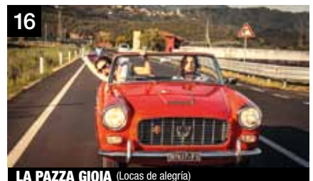
16 LA PAZZA GIOIA (Locas de alegría)

Pierre es un adolescente como cualquier otro. Pero después de un análisis de ADN, descubre que quien cree su madre no lo es realmente y debe trasladarse con su familia biológica.