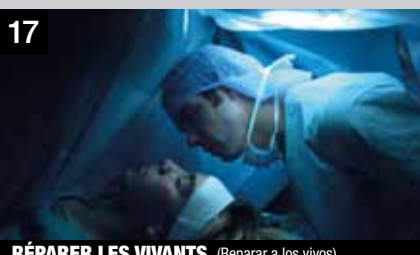
17 RÉPARER LES VIVANTS (Reparar a los vivos)

Beatrice y Donatella reciben tratamiento en una clínica psiquiátrica. Cuando escapan de esta institución, se lanzan a la búsqueda del amor y la felicidad en el manicomio al aire libre que es el mundo de los cuerdos.